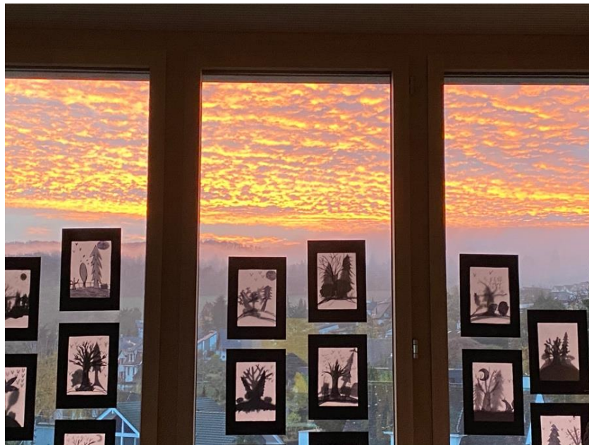
Ein morgendlicher Flammenhimmel!