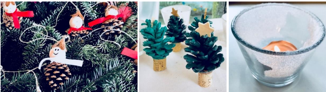
Caroline Filli und Alisa Girlich

So konnten wir am Samstagabend nach dem Weihnachtsmarkt glücklich und zufrieden - und auch ein kleines bisschen erschöpft - auf eine erlebnisreiche Woche mit vielen schönen Erinnerungen und neuen Bekanntschaften zurückblicken.